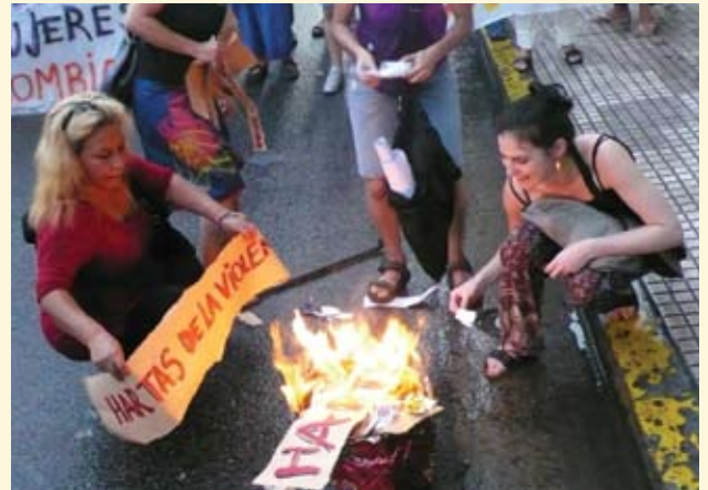
MARCHA CONTRA LA VIOLENCIA DE GÉNERO 2009