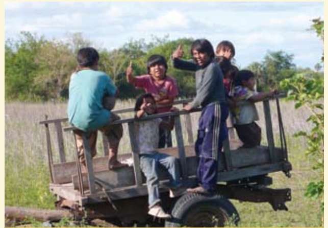
"NIÑOS DE LA COMUNIDAD TOBA LA PRIMAVERA EN FORMOSA"