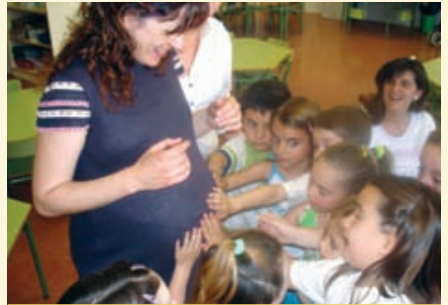
LA SALUD MATERNA, UNO DE LOS OBJETIVOS DE DESARROLLO DEL MILENIO

pulso para el cumplimiento de los ODM desde diferentes aspectos. Claramente una nota sobre VIH puede ayudar a combatir la propagación de esta enfermedad. La realización de informes sobre pobreza teniendo en cuenta cómo influye de manera diferencial a mujeres y varones. - Argentina se comprometió a cumplir con estas metas y para esto se desarrollan acciones que se informan en un Informe País. Asimismo, algunas provincias también lo hacen. Los ODM son un buen indicador y una excelente oportunidad para la prensa para cumplir con su rol de control de la gestión pública. - Muchas Organizaciones de la Sociedad Civil (OSC) trabajan a diario en pos del logro de estos objetivos. Detrás de cada OSC hay una ejemplo de solución a los problemas que intentan solucionar los ODM. - Es interesante sumar testimonios e historias de vida que le otorguen humanidad a los datos de avance de los ODM. También en este caso las OSC pueden ser de gran ayuda.