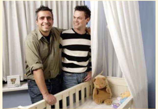
PAREJA GAY DE HOLANDA EN LA BÚSQUEDA DE LA ADOPCIÓN DE UN HIJO