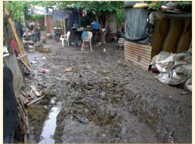
CASA DESBASTADA POR UNA INUNDACIÓN.

- Por año mueren en Argentina 333 mujeres durante el embarazo, parto y puerperio, y 11.000 niños menores de 5 años, de los cuales 6.000 son recién nacidos. Investigaciones nacionales demuestran que al menos 2/3 partes de estas muertes son evitables, es decir, 7.600 mujeres y niños podrían salvarse y sobrevivir.